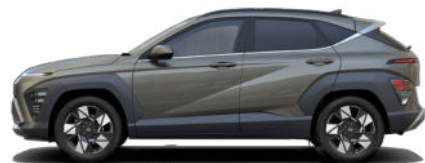
Amazon Gray Metallic (nicht verfügbar für Hybrid und N Line)