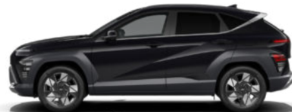
Abyss Black Pearl nicht verfügbar für Hybrid