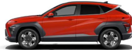
Soultronic Orange Pearl nicht verfügbar für Benzin und N Line