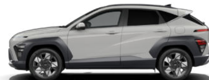
Cyber Gray Metallic